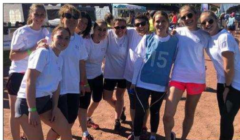
Les jeunes femmes sont allées au bout de leur rêve en réussissant cette course en relais de 235 kilomètres.

Alors que la cagnotte Leetchi est encore en ligne jusqu'au