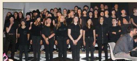
Une partie des 130 choristes.